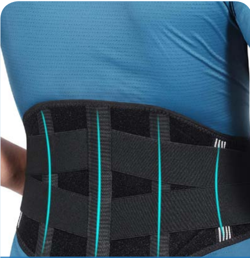
أحزمة ومشدات طبية