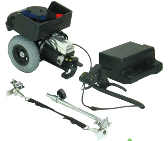
مساعد دفع الكرسي المتحرك PowerStroll