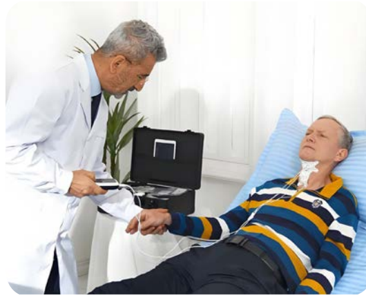
إعادة التأهيل العصبي