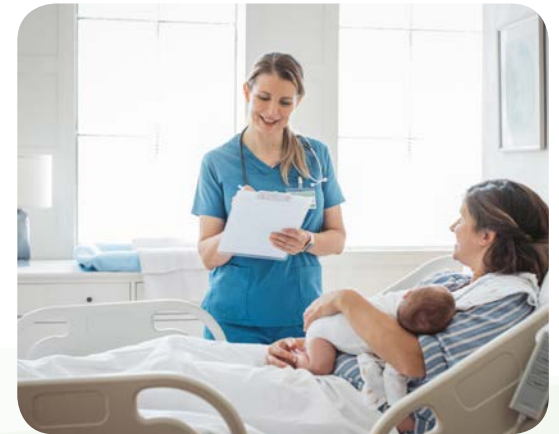
إعادة التأهيل بعد الولادة