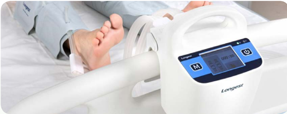
الوقاية من الجلطات الدموية الوريدية