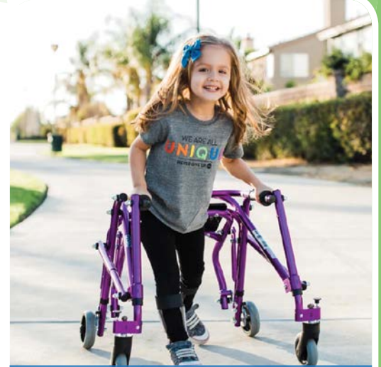
مستلزمات ذوي الإحتياجات الخاصة