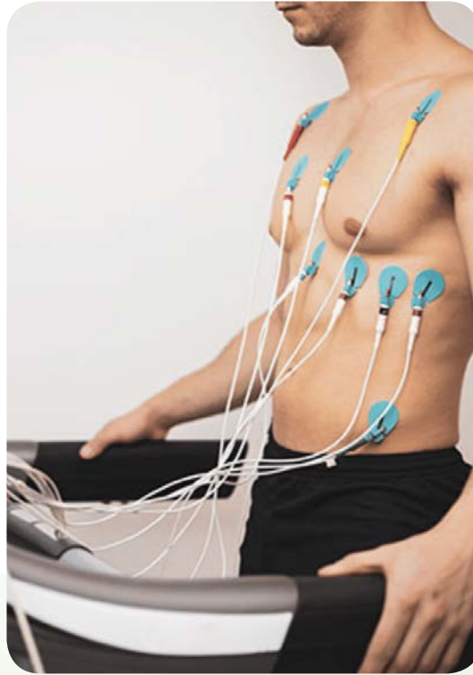
إعادة التأهيل الرياضي