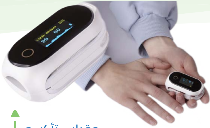
مقياس تأكسج النبض بالإصبع